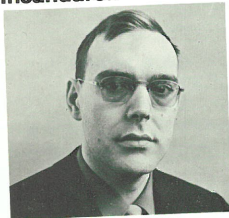
Som förslagsställare till ett informationsblad inom Verktögssektorn, har

jag anledning att vara tacksam över Ställskruvens tillkomst.