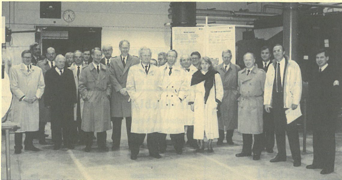
ABBs forskningselit har just anlänt till Forskningslaboratoriet där de fick utförlig information om pågående projekt.

Vad gäller de äldre upplagorna av "de gröna" katalogerna finns självfallet en hel del uppgifter som är föråldrade. I de fall där