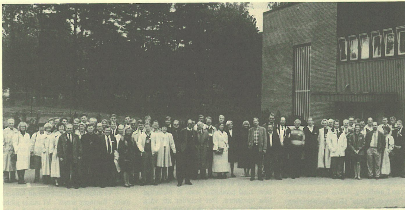
Konferensdeltagarna samlade utanför utvecklingscentret.

Personalchefer, personaladministratörer från de olika ABB-bolagen i Sverige och ABBs centrala personalstab har varit samlade till en 2-dagars konferens i Växjö.