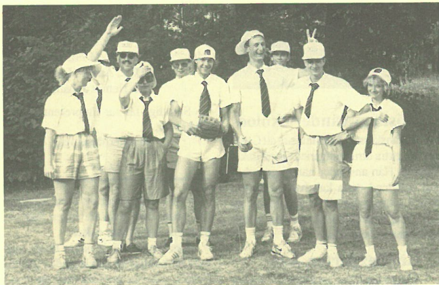
Vi ser det vinnande och nöjda DK-laget.

DK antog utmaningen från PI att spela en brännbollsmatch mot dem.