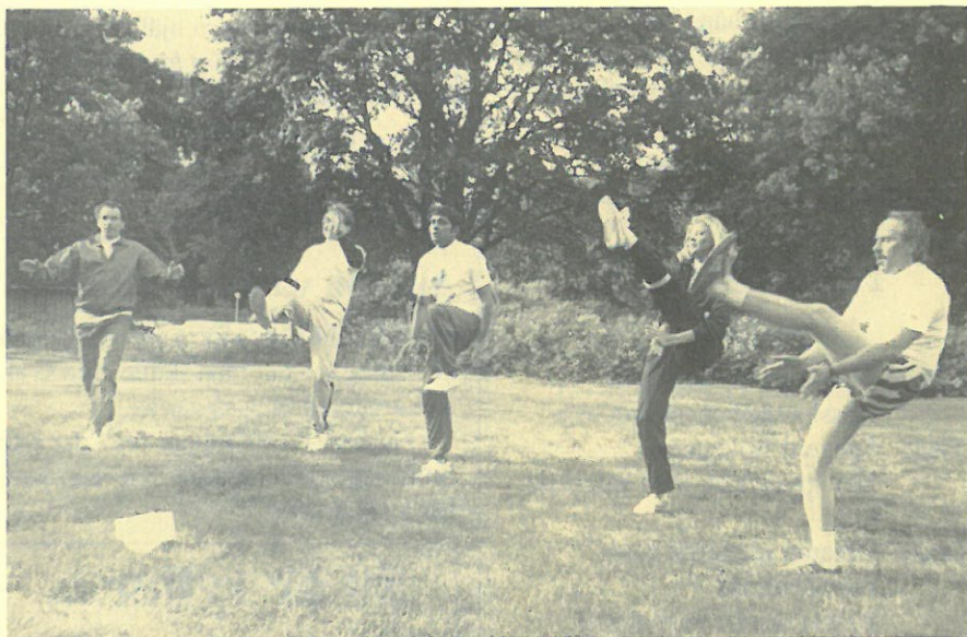
Lite uppmjukningsövningar efter joggingen behövs också.

Femton deltagare, från tolv länder, har varit samlade till en konferensvecka på Toftaholm Herrgårdshotell.